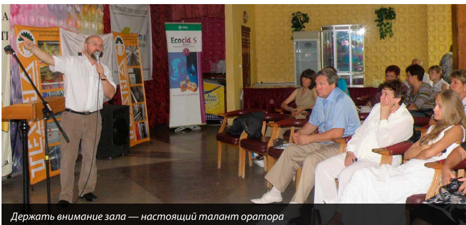
Держать внимание зала — настоящий талант оратора