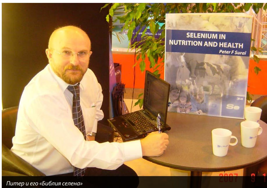
Питер и его «Библия селена»