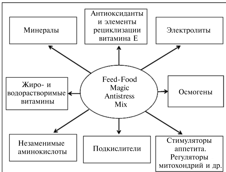
Рис. 2. Важнейшие компоненты антистрессового препарата нового поколения Feed-Food Magic Antistress Mix, регулирующие экспрессию витагенов и участвующие в максимальной мобилизации защитных сил организма (по группам химических соединений).

Показания к применению антистрессового препарата в промышленных условиях. Результаты исследований свидетельствуют о том, что при выращивании цыплят-бройлеров, ремонтного молодняка, а также при содержании родительского стада кур и промышленных несушек предлагаемая концепция эффективной антистрессовой защиты предполагает использование разработанного препарата в критические периоды развития и выращивания птицы: